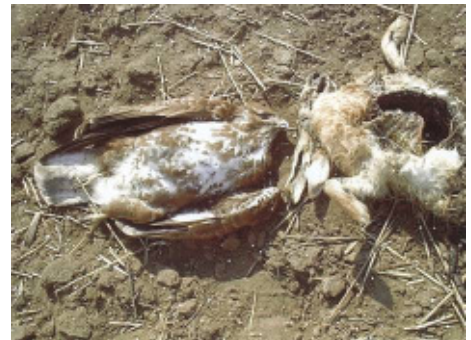
Abb. 1: Ein vergifteter Mäusebussard in unmittelbarer Nähe des Köders, eines Feldhasenkadavers.

Giftverdachtsfälle bei Haustieren werden zumeist über den Besitzer und/oder den Tierarzt angezeigt. Offensichtlich wird ein Vergiftungsverdacht meist durch plötzlich auftretende Krämpfe und durch Erbrechen der Tiere . Die Tierärzte sollten angehalten werden, vermeintlich kontaminiertes Material (z.B. Erbrochenes) aufzubewahren und für eine Laboruntersuchung bereitzustellen.