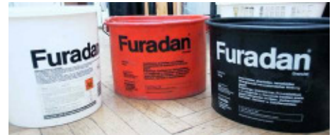
Abb. 5 u. 6: Carbofuran als Furadan® Granulat. Dieses Pflanzenschutzmittel wird sehr oft zum Präparieren von Giftködern verwendet. Bei Vögeln wirkt es besonders schnell und ist bereits in sehr geringen Dosen tödlich.