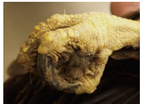
Abb. 2: Der verkrampfte Greif eines durch Gift verendeten Kaiseradlers. Verkrampfungen an toten Tieren sind Indizien für das Vorliegen einer Vergiftung.