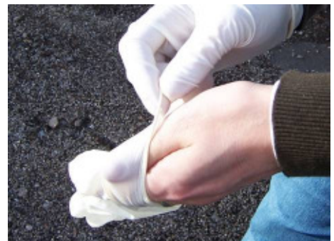
Abb. 11: Aus Gründen des Eigenschutzes sollte auf Handschuhe unter keinen Umständen verzichtet werden.