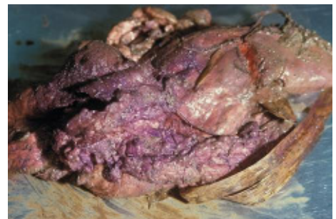
Abb. 3: Ein mit Carbofuran präparierter und als Giftköder verwendeter Aufbruch. Die blauviolette Warnfärbung ist leicht erkennbar.