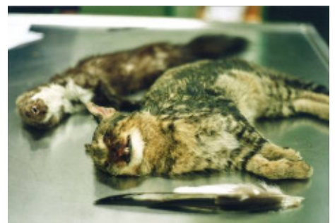
Abb. 14: Eine mit Carbofuran vergiftete Katze und ein Steinmarder. Die verkrampften Gesichtszüge weisen auf einen qualvollen Tod hin. Haustiere werden am Institut für Pathologie der Veterinärmedizinischen Universität in Wien untersucht.