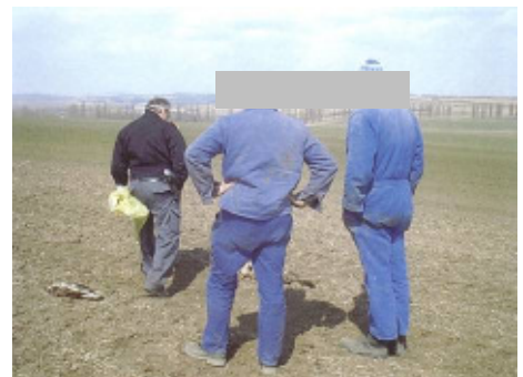
Abb. 10: Am Fundort wird unter dem Beisein der Finder ein Augenschein durchgeführt. Im Bild eine Sachverhaltsaufnahme durch einen Beamten des GP Bernhardsthal im Frühjahr 2003.