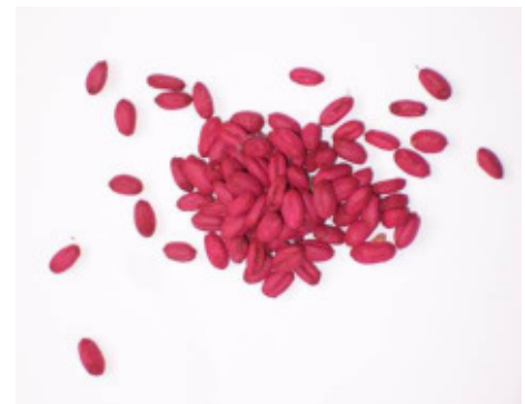
Abb. 8: Beispiel für ein Giftweizenpräparat mit roter Warnfärbung. Der Wirkstoff beim abgebildeten Präparat ist Zinkphosphid.