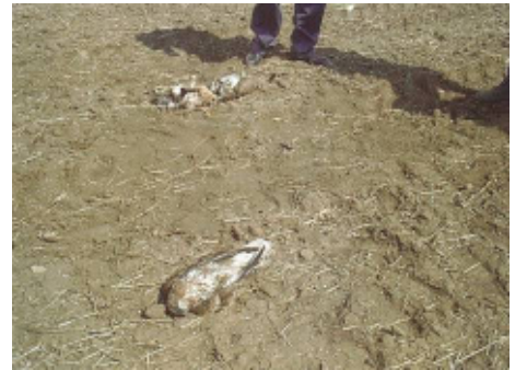
Abb. 9: Der Fund zweier Mäusebussarde in unmittelbarer Nähe zu einem Giftköder auf freiem Feld. Ein typischer Giftfall.

Da in vielen Fällen durch einen Giftköder mehrere Opfer zu beklagen sind, ist die Nachsuche nach weiteren Opfern ebenfalls sehr wichtig. Vögel (z.B. Mäusebussarde, Seeadler,...), auf die das Gift besonders schnell wirkt, sind meist unweit des Köders in