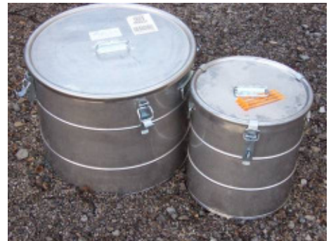
Abb. 15: Behälter, wie die hier abgebildeten Hobbocks, stehen an allen Veterinärabteilungen der Bezirksverwaltungsbehörden zum Versand von Kadavern und vermeintlichen Ködern bereit.

An allen Veterinärabteilungen der Bezirksverwaltungsbehörden stehen Hobbocks (plombierbare Behälter) zur Verfügung. Diese werden mit der Post auf dem schnellsten Weg an die Untersuchungsstelle geschickt. Sollten die Hobbocks nicht verfügbar sein, wird das Untersuchungsmaterial gut verpackt und am besten vorab gekühlt oder gefroren verschickt. Beim Verpacken ist in jedem Fall darauf zu achten, dass das kontaminierte Material in mehrere Plastiksäcke verpackt wird und absolut dicht ist, damit sich beim Auftauen des Materials keine Gefahr bei der Weiterbearbeitung dieses Paketes (z.B. für Postbedienstete) ergibt.