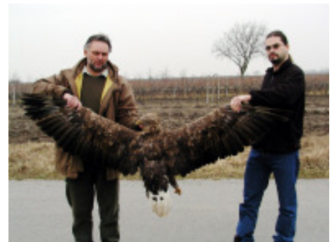
Abb. 16: In allen Bundesländern steht der Seeadler unter Naturschutz oder unter ganzjähriger Schonung. Er galt lange als ausgestorben und kehrt nun langsam nach Österreich zurück. Bisher wurden 17 Seeadler Opfer von Giftködern.

Primär sind die Strafnormen nach dem Strafgesetzbuch heran zu ziehen. Die wichtigste Strafnorm ist in jedem Fall der § 222 StGB – Tierquälerei , der im Fall einer Vergiftung von Haus- und Wildtieren herangezogen werden kann. Bei Haustieren kann auch der Tatbestand der Sachbeschädigung (§ 125 StGB) ins Treffen geführt werden. § 138 StGB als schwerer Eingriff in ein fremdes Jagdrecht kann bei Vergiftungsfällen von Wildtieren vorliegen. Die Tatbestände der §§ 176 und 177 StGB - vorsätzliche und fahrlässige Gemeingefährdung - eignen sich nur in besonders schweren Fällen von Giftausbringung, für den „Normalfall“ sind sie nicht geeignet.