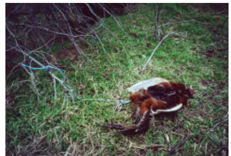
Abb. 4: Ein als Köder verwendeter und befestigter Fasan. Auch dieses Tier wurde mit Furadan® präpariert.