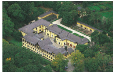
Abb. 13: Am Forschungsinstitut für Wildtierkunde am Wilhelminenberg werden die Untersuchungen an verendeten Wildtieren und mutmaßlichen Ködern durchgeführt.