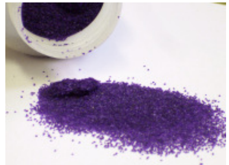
Abb. 7: Carbofuran als Furadan® Granulat. Typisch ist die blauviolette Warnfärbung.